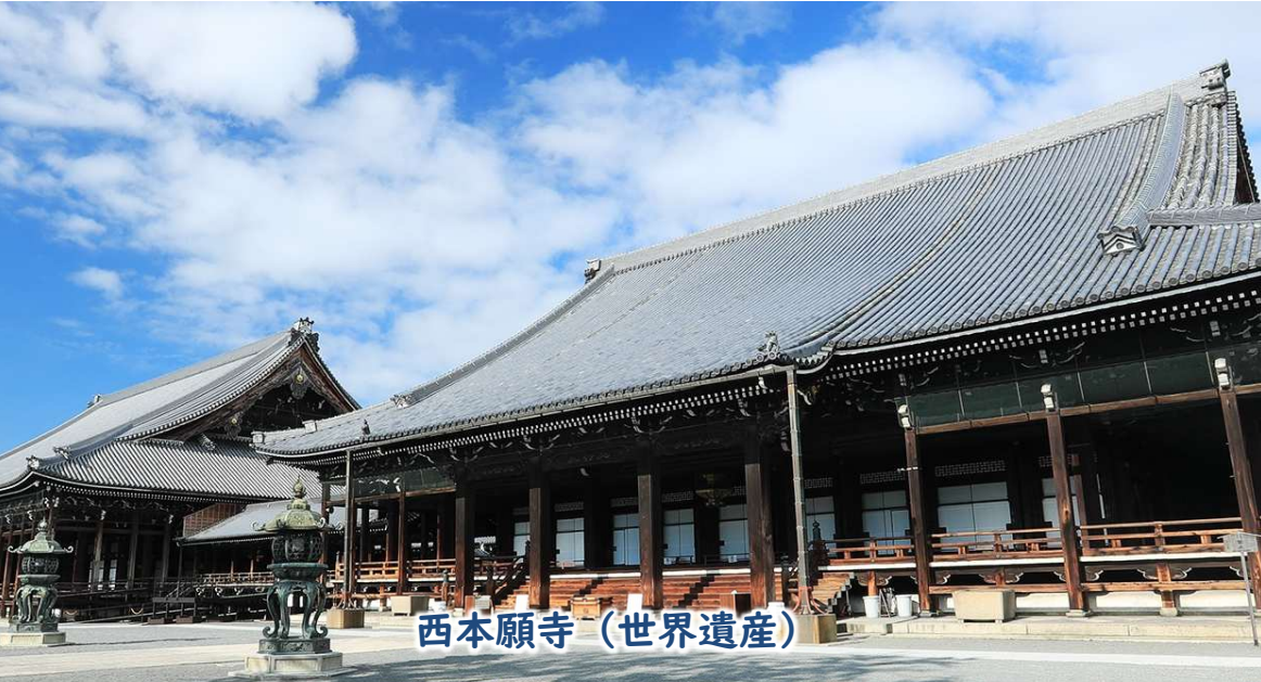
西本願寺（世界遺産）